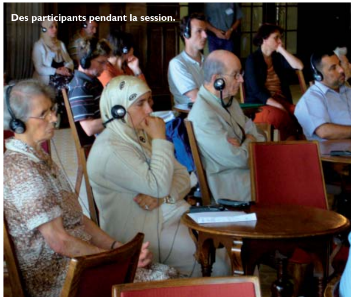
Des participants pendant la session.

Du 20 au 24 juillet s'est tenue la session « Le Dialogue des civilisations commence à la base ». Ce thème faisait écho à l'appel à une alliance des civilisations lancé en 2005 par les Nations Unies dans le but de combattre préjugés et incompréhensions entre groupes culturels, notamment entre monde occidental et musulman.