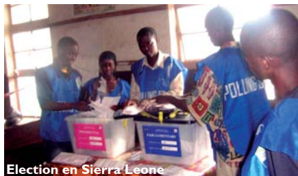
Election en Sierra Leone

Le 11 août dernier avaient lieu en Sierra Leone les premières élections présidentielles et législatives depuis le retrait, en 2005, des troupes de maintien de la paix des Nations Unies. Elections qui ont été reconnues comme libres, honnêtes et surtout sans violence grâce au rôle joué par la société civile. Un succès auquel ont contribué les vingt-trois observateurs formés par Hope Sierra Leone (HSL), une ONG affiliée à I&C et qui mène depuis le début de l'année une « campagne pour des élections sans fraude ».