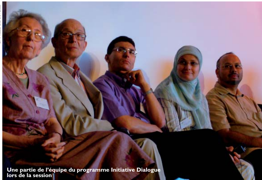
Une partie de l'équipe du programme Initiative Dialogue lors de la session