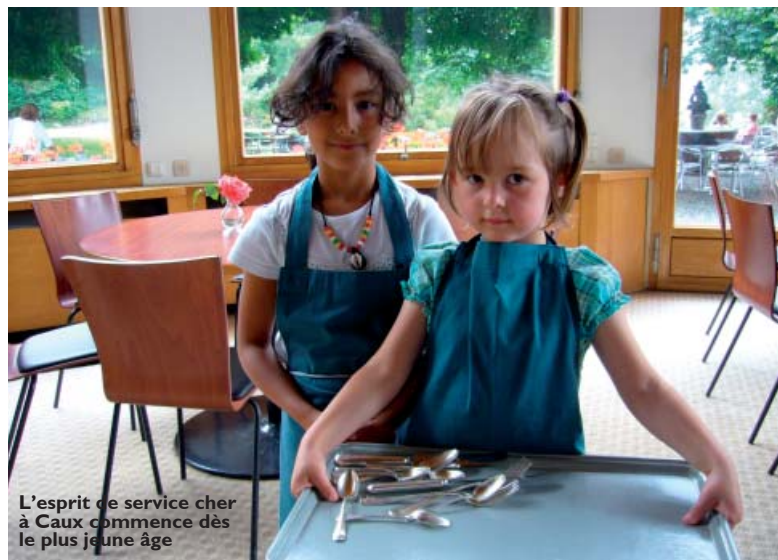
L'esprit de service cher à Caux commence dès le plus jeune âge

Les visiteurs de Caux sont frappés par l'esprit qui y règne. Quelques notes d'ambiance récoltées sur le blog de la conférence.