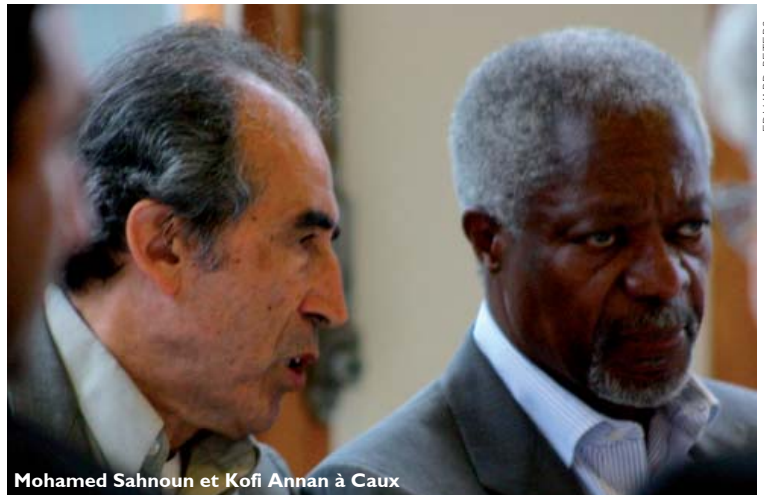
Mohamed Sahnoun et Kofi Annan à Caux

« Tout commence par la communauté, et c'est ce que vous faites ici dans ce village mondial sur la montagne. » C'est ainsi que Kofi Annan, l'ancien Secrétaire Général des Nations Unies, a défini le centre international d'Initiatives et Changement à Caux, en Suisse, lors de sa visite le 8 août 2007.