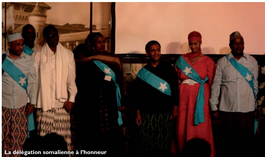
La délégation somalienne à l'honneur

Plus de trois cents personnes se sont penchées sur les causes profondes des conflits et les réponses adaptées. Une dernière session en forme de tour du monde où les questions de spiritualité, de religion et d'identité ont joué un grand rôle.