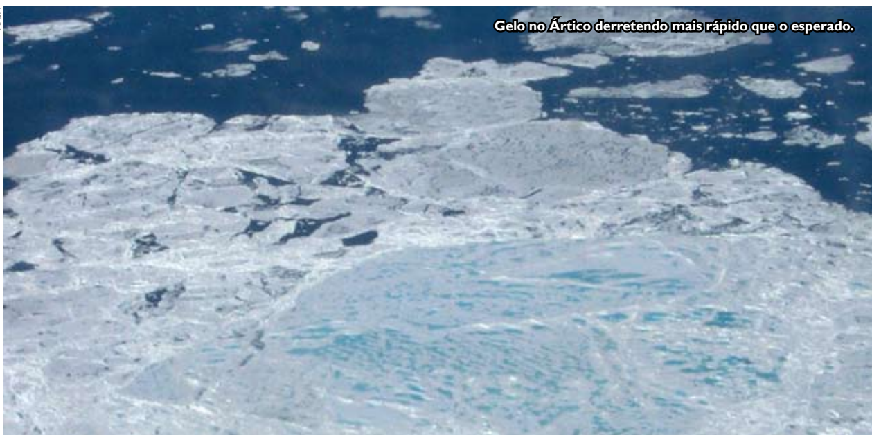
Gelo no Ártico derretendo mais rápido que o esperado.