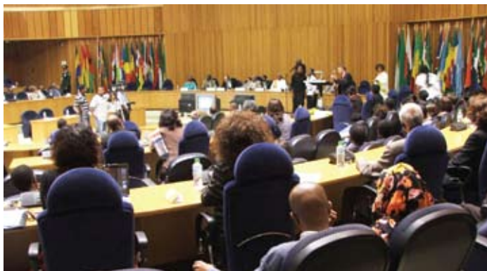
Lançamento de IdeM Etiópia

Iniciativas de Mudança - Etiópia foi oficialmente lançado em Addis Ababa em 16 de Outubro de 2009, no salão da União Africana com a presença de Sua Excelência Dr. Girma Wolde-Giorgis, Presidente da República Democrática Federal