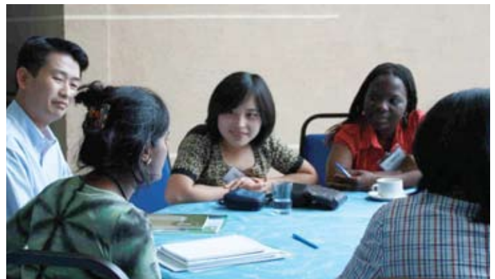
Grupo World Cafe

“Encontrar pasión en el corazón del liderazgo para el cambio”, “Espacio abierto”, foros sobre asuntos particulares que motivan el cambio. Se formaron grupos para discutir sobre iniciativas para introducir un Día Nacional de la Reconciliación en Malasia, para escuchar las historias de los indígenas desplazados por el desarrollo y para iniciar Círculos de Creadoras de Paz.