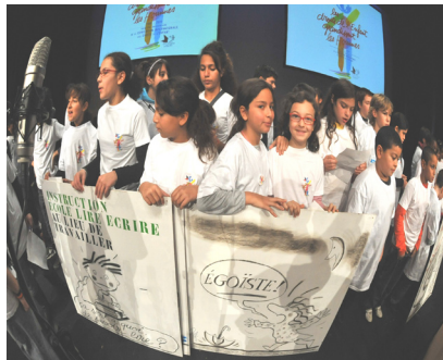
Club "copains du monde"

Les jeunes s'engagent dans le domaine de la solidarité nationale ou internationale, dans les associations de quartier, voire dans la politique locale. En famille ou tous seuls, du parrainage à l'école en passant par l'investissement en faveur de la protection de l'environnement... les champs d'action du bénévolat des mineurs sont vraiment étendus et les potentiels et résultats de cet engagement souvent sous-estimés.