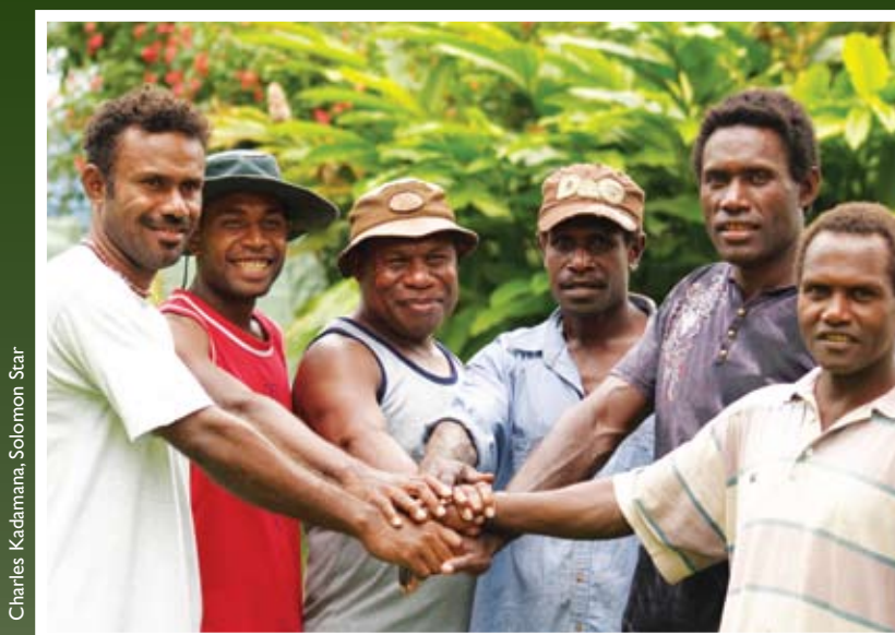
Charles Kadamana, Solomon Star