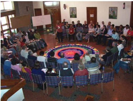
Plenárias da Consulta Global Especial

No total, 86 pessoas representavam 32 países de todos os continentes, trazendo consigo experiências pessoais e de equipe, e ainda esperança de poderem sair dali com espírito renovado. Uma dinâmica pedindo que pessoas escrevessem em um post-it sua resposta à pergunta anterior fez cada um levantar-se, pronunciar-se e colar sua resposta num quadro, conforme cada um se expunha. Depois foi perguntado que iniciativas precisamos iniciar, aumentar, diminuir ou parar, e mais uma vez pessoas colaram suas idéias nas paredes do foyer. Uma proposição livre, descomprometida de formalidades e bastante objetiva. Alguém precisou recolher tudo aquilo e, noutro dia, já tinha um levantamento das principais frentes de trabalho para reflexão nos dias decorrentes.