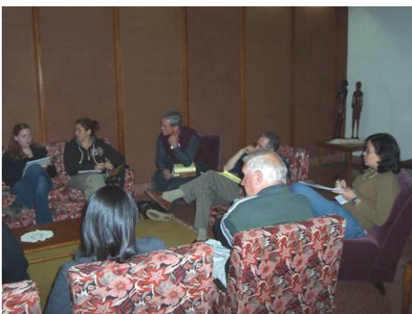
Grupo das Américas em AP

comunicação (ainda em inglês), e periodicamente fornecer um sumário traduzido para o Português e para o Espanhol, de forma a deixar todos cientes e com condições de contribuir continuamente. Campanha Eleições Limpas, Conversas Honestas em Comunidade e Trabalho com Jovens parecem ser as ações que inicialmente poderíamos promover em todos os países das Américas, para assim darmos suporte uns aos outros.