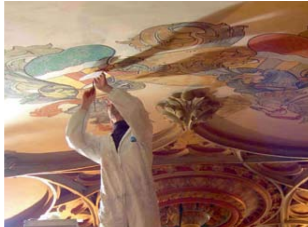
Detailarbeit an der Decke der Grossen Halle