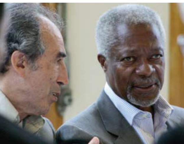
Mohamed Sahnoun, Präsident von Initiativen der Veränderung International, im Gespräch mit Kofi Annan

Zum ersten Mal fand 2007 die Konferenz «Dialog der Zivilisationen an der Basis» statt, die federführend von einem französischen Team organisiert wurde, das in den Vororten von Paris mit dem Programm «Initiative Dialogue» wertvolle Erfahrungen im Bereich interkultureller Dialog, insbesondere zwischen der «alteingesessenen» französischen Bevölkerung und arabischstämmigen Französischen und Franzosen sammelte. Diese Konferenz in Caux ermöglichte einen Austausch über die Erfahrungen in diesem Bereich in Frankreich und in anderen Ländern Europas. Sie stiess auf ein reges Interesse und