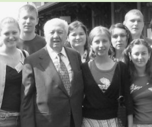
L'ancien président de la République du Portugal, Mário Soares, rencontre des participants du «Forum des Jeunes Politiciens» pendant son séjour à Caux.