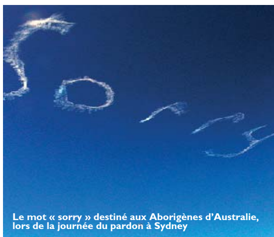
Le mot « sorry » destiné aux Aborigènes d'Australie, lors de la journée du pardon à Sydney

Par la suite, de nombreuses autres villes et localités ont aussi organisé des marches. Environ un million de personnes y ont participé. Si de nombreuses victimes des générations volées défilèrent sous la bannière des « Chemins de guérison » à Sydney, une femme, elle, me téléphona, furieuse. Elle m'a dit qu'après ce qu'elle avait subi, aucune guérison n'était possible, et qu'elle ne se joindrait à nous