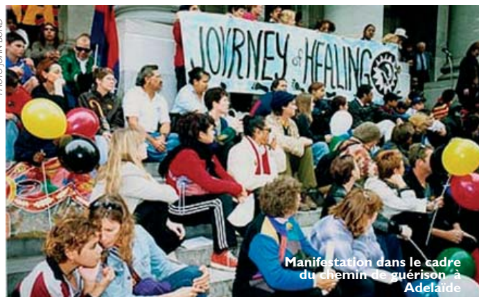
Manifestation dans le cadre du chemin de guérison à Adelaïde