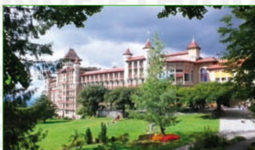
Le centre de rencontres de la Fondation Caux Initiatives et Changement (Suisse)

En 2001, le Réarmement moral a pris l'appellation Initiatives et Changement .