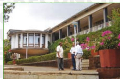
Le centre asiatique de rencontres de Panchgani (Inde)