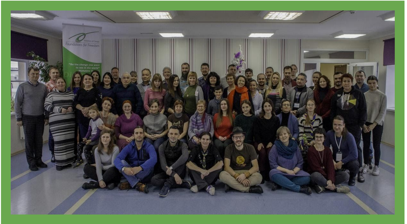
Фото з Регіональної зустрічі 2019 року

Як і в попередні роки, багато українців брали участь у Саух Форумах . Вони були активні у дискусіях і зустрічах щодо примирення, побудови довіри, зцілення ран минулого та принесли український досвід, зокрема досвід "Основ свободи".